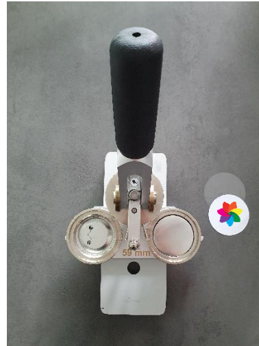
2. Rückteil links / Vorderteil rechts