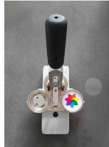
3. Papier auf Vorderseite legen