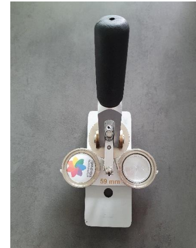
8. zurückdrehen (Button ist fertig)