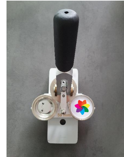
4. Folie auf Papier legen