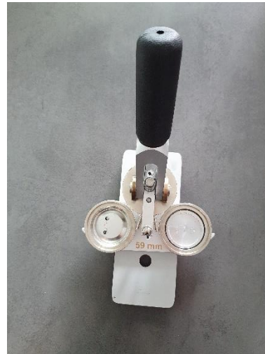
6. zurückdrehen (Vorderseite ist weg)